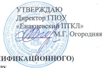
ГРАФИК ПРОВЕДЕНИЯ ГИА И ЭКЗАМЕНА (КВАЛИФИКАЦИОННОГО) в 2017-2018 учебном году